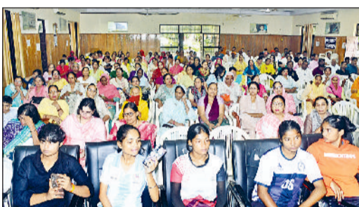
—1—जिला विकास भवन में आयोजित कार्यक्रम में उपस्थित लोग।

मेयर राम अवतार वाल्मीकि ने आमजन से महर्षि वाल्मीकि के जीवन से प्रेरणा लेने का आह्वान किया है। राम अवतार वाल्मीकि आज जिला विकास भवन में संत महापुरुष सम्मान एवं विचार-प्रसार योजना के तहत महर्षि वाल्मीकि की जयंती पर आयोजित जिला स्तरीय कार्यक्रम में बतौर मुख्य अतिथि उपस्थित लोगों को संबोधित कर रहे थे।