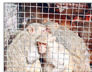
हरिभूमि न्यूज | रोहतक

बंदरों के काटने के मामले साल दर साल बढ़ रहे हैं। 2020 के 8 महीनों में 982 मामले सामने आए थे। यह संख्या 2024 में बढ़कर 1,559 और 2025 के 8 महीनों में 1,372 तक पहुंच चुकी है।