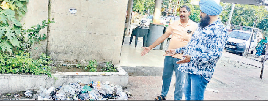
त्योहारों में सफाई व्यवस्था सुदृढ़, बाजारों में होनी स्वच्छ

हरिभूमि न्यूज ▶▶ रोहतक त्योहारों का शुरू हो चुके है, लेकिन शहर की प्रमुख बाजारों में गंदगी और कूड़े के ढेर लोगों की खुशियों पर ग्रह लगा रहे हैं। दीपावली, धनतेरस और करवाचौथ जैसे त्योहारों के नजदीक आने के बावजूद नगर निगम की सफाई व्यवस्था पूरी तरह लचर नजर आ रही है। शहर के सेक्टर-2-3 की मार्केट, रेलवे रोड, मॉडल टाउन मार्केट, ओल्ड सब्जी मंडी, जाट कॉलेज रोड और शीला बाईपास क्षेत्र की दुकानों के सामने जगह-जगह कूड़े के ढेर लगे हैं। कई स्थानों पर नालियों का पानी भी ओवरफ्लो हो रहा है, जिससे बदबू और मच्छरों का प्रकोप बढ़ गया है। दुकानदारों का कहना है कि सफाई कर्मचारी कई-कई दिनों तक नहीं आते, जिससे बाजार का माहौल अस्वच्छ बना रहता है। ग्राहकों को खरीदारी के दौरान दुर्गंध और गंदगी का सामना करना पड़ता है। इससे न केवल व्यापार पर असर पड़ रहा है बल्कि त्योहारों की रौनक भी फीकी पड़ रही है। स्थानीय व्यापारियों ने नगर निगम प्रशासन से जल्द सफाई व्यवस्था दुरुस्त करने की मांग की है।