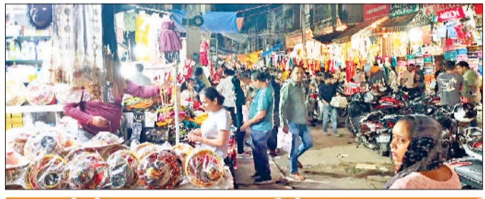
बाजारों में सुरक्षा व्यवस्था पर विशेष ध्यान

हरिभूमि न्यूज ▶▶ रोहतक करवाचौथ का त्योहार नजदीक आते ही शहर की मार्केटों में उत्साह और खरीदारी की चहल-पहल देखने को मिली। महिलाएं अपने परिवार और दोस्तों के साथ सजे-धजे बाजारों में लहंगे, साड़ियों, ज्वैलरी और मेहंदी का सामान खरीदने के लिए पहुंची। रेलवे रोड, मॉडल टाउन और शीला बाईपास स्थित मार्केटों में सुबह से ही भीड़ उमड़ी रही। इस मौके पर स्थानीय दुकानदारों ने बताया कि महिलाओं ने पहले से ही अपने मनपसंद डिजाइन और स्टाइल के अनुसार लहंगे और साड़ी खरीदने की योजना बना रखी थी। कई दुकानों पर विशेष डिजाइन के लहंगे और पारंपरिक ज्वैलरी की बिक्री इस वर्ष पहले से अधिक रही। ज्वैलरी की दुकानों में ग्राहक पारंपरिक आभूषणों के साथ-साथ आधुनिक डिजाइनों को भी खरीद रही थीं। महिलाओं ने अपने हाथों में सजावट के लिए मेहंदी की बुकिंग कराई। कई पार्लरों में महिलाओं के हाथों में मेहंदी लगाने के लिए लंबी कतारें लगी हुई थीं। ब्यूटी पार्लरों में भी इस समय महिला ग्राहकों की अच्छी-खासी भीड़ रही।