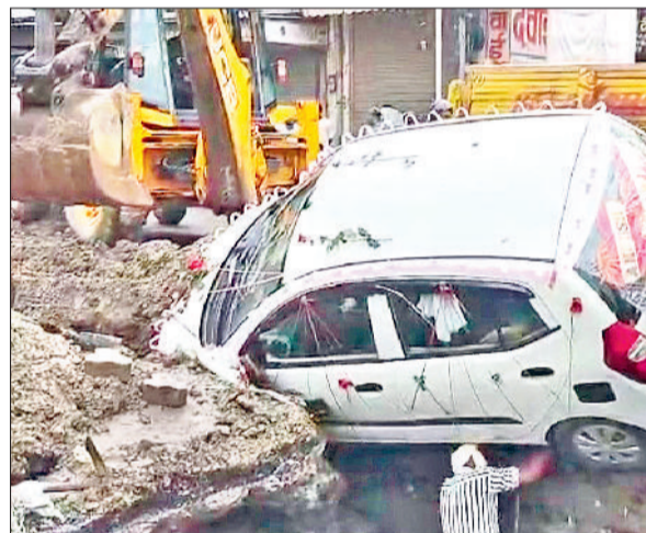
रोहतक। गड्ढे में गिरी कार।