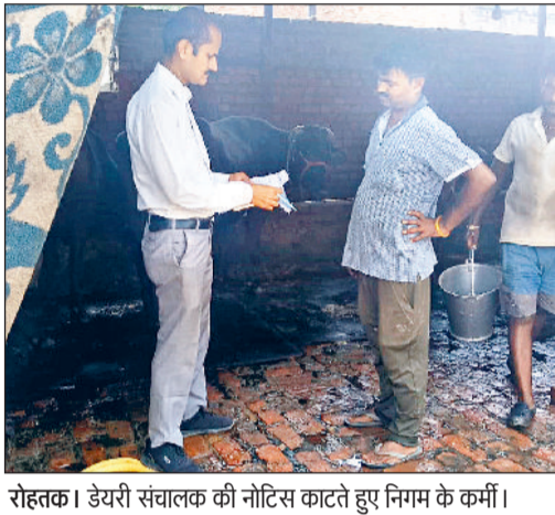
रोहतक। डेयरी संचालक की नोटिस काटते हुए निगम के कर्मी।

नालों व सीवर में गोबर या अन्य ठोस अपशिष्ट बहाना अपराध नगर निगम ने 6 डेयरी संचालकों को जारी किए सीलिंग नोटिस