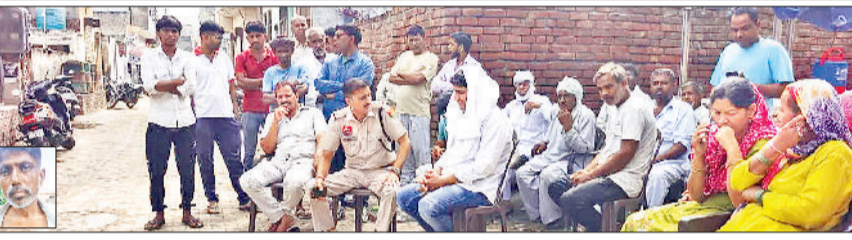
रोहतक। सूर्य नगर में मौके पर मृतक के परिजनों से बातचीत करते पुलिस अधिकारी।

ग्रामीण इलाकों से लेकर शहर की गलियों तक खून से लथपथ घटनाओं ने जनमानस में भय का वातावरण बना दिया है। 30 सितम्बर से 7 अक्टूबर के बीच वारदातें हुईं