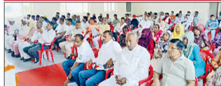
महम। वाल्मीकि जयंती समारोह में मौजूद श्रद्धालु।